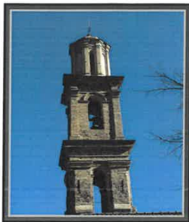
LUGO DI NAZZA Mairie