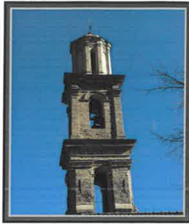
LUGO DI NAZZA Mairie