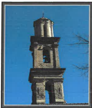
LUGO DI NAZZA Mairie