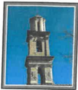
LUGO DI NAZZA Mairie