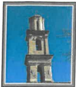
LUGO DI NAZZA Mairie