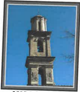
LUGO DI NAZZA Mairie